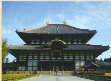
◆東大寺大仏殿と大仏尊像