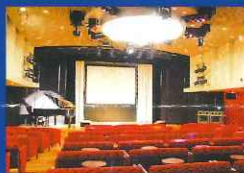
ラウンジ『サザンクロス』 (きそ)