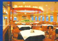
レストラン『タヒチ』 (きそ)

※いしかり、きそは全客室において禁煙となっております。喫煙は所定の場所においてお願い致します。