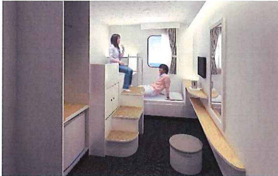
⑦1等クロスツイン 国内のフェリー・陸上のホテルでも類を見ない交差した2段ベッドが特徴。