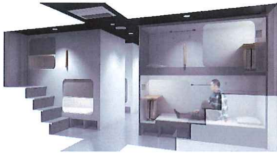
⑤B 寝台 従来の同等級より快適性を追求したカプセル寝台。