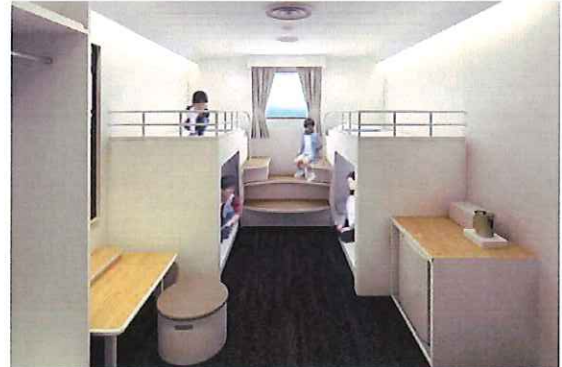
⑧1等フォース お子様連れやグループ旅行を想定し、2段ベッドの下端部分をベッドではなく段差のないフラットフロアで構成し、多様な空間利用が可能。