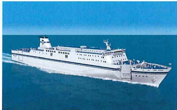
新「きたかみ」船体完成予想

6階から7階は定員535人の旅客フロアで、客室、レストラン、展望大浴場などを設置します。最上階の8階は操舵室(ブリッジ)と乗組員用のスペースになっています。