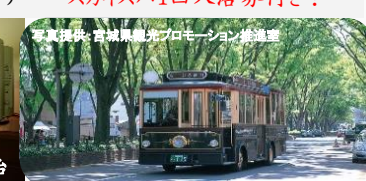
札幌観光宮城東照宮プロモーション 全道営業