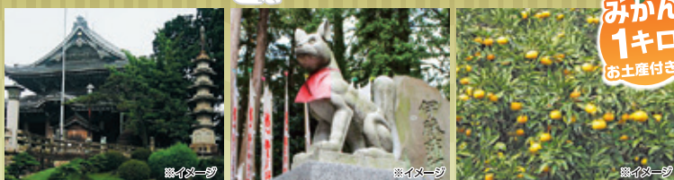
◆豊川稲荷(曹洞宗のお寺で正式名称は「豊川園妙厳寺」) ◆霊狐塚 ◆蒲郡オレンジパーク